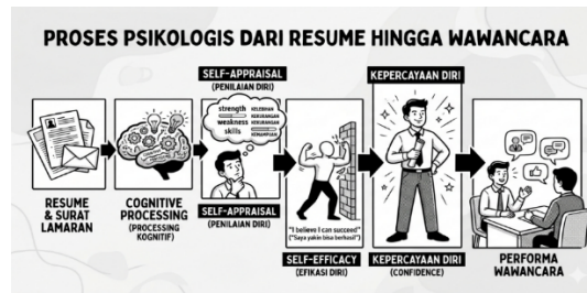
Gambar 1. Model Konseptual Pengaruh Penulisan Resume dan Surat Lamaran terhadap Kepercayaan Diri Wawancara